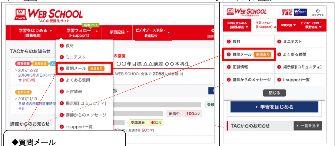
[スマートフォン画面]