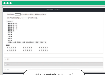
科目B試験イメージ