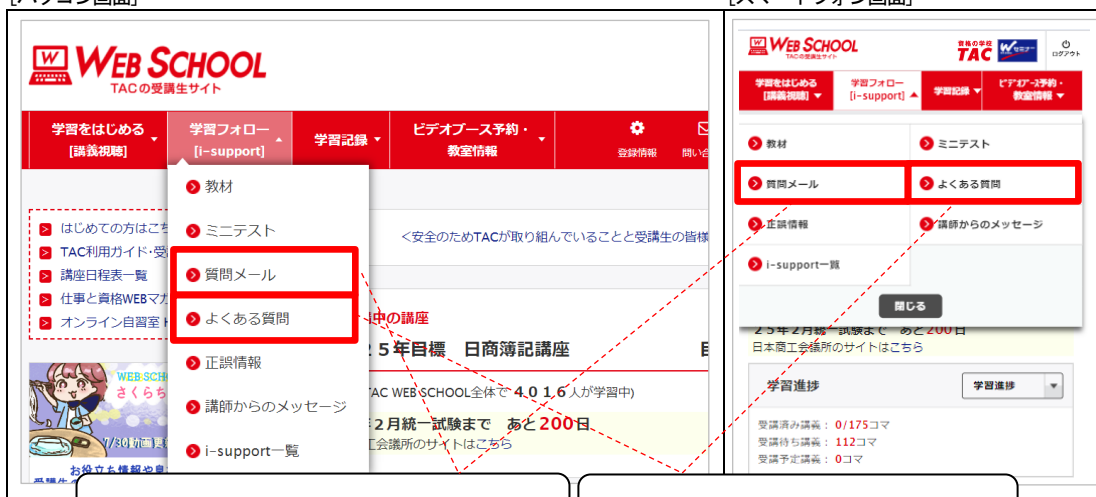
[スマートフォン画面]