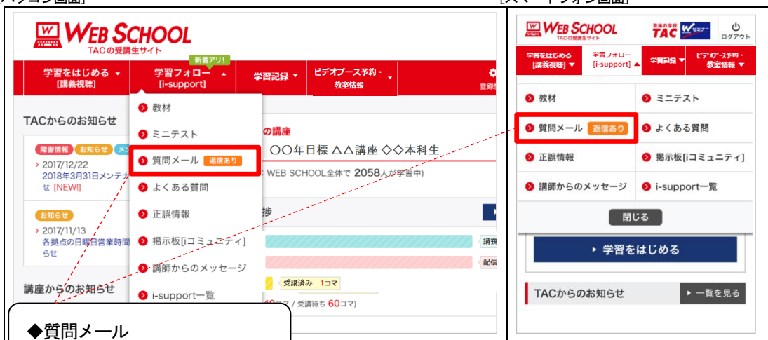
[スマートフォン画面]